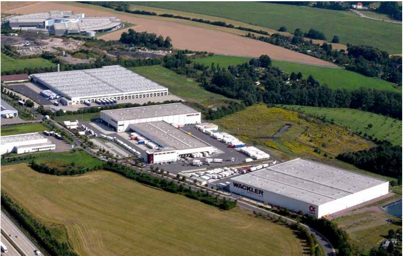
Heute verfügt Wackler über 26.000 qm logistische Nutzfläche am Standort Wilsdruff.

Wilsdruff auf einem Grundstück von über 100.000 qm, die eine Logistikfläche von 20.000 qm sowie eine Umschlagfläche von 5.700 qm umfasst. Rund 240 Mitarbeiter und knapp 45 tägliche Linienverkehre sorgen dafür, dass jeden Tag bis zu 1.000 Sendungen ein- und ausgehen.