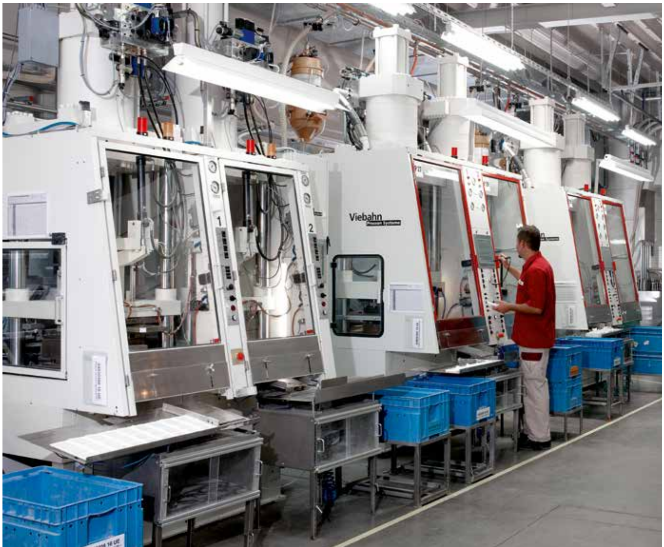
SchoPlast ist führend im Bereich der Duro- und Thermoplastverarbeitung im Spritzgießverfahren.

„Der Start war hart. Der Betrieb musste in den Jahren nach der Wende eine seiner schwierigsten Phasen überstehen. Die traditionell produzierten Güter waren