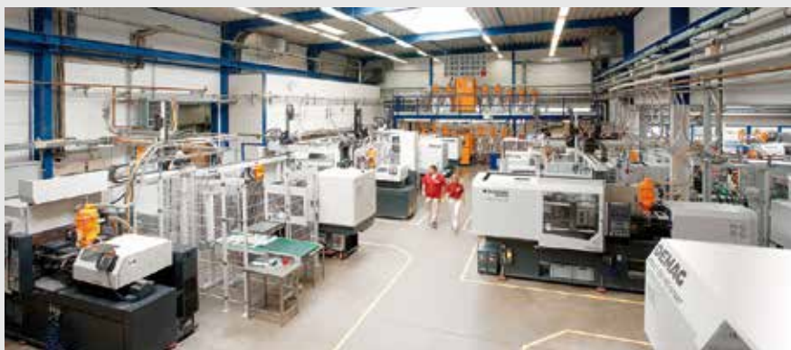
SchoPlast liefert hochwertige technische Formteile für die Elektro- und Automobilindustrie.